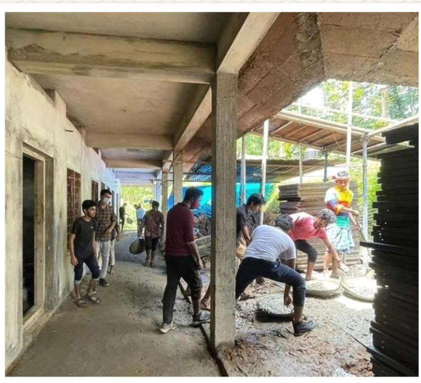
Construction of Old Age Home by Students of SJCET at Manchuvadu, Kuravilangad, 8 th to 10 th October 2021

Managed by the Catholic Diocese of Palai • Approved by AICTE • Affiliated to APJ Abdul Kalam Technological University, Kerala