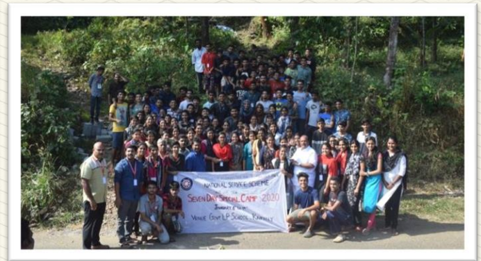
SWACHH BHARAT MISSION: NSS Volunteers in the presence of MLA of Poonjar Shri P.C George Cleaning the Road to Forest nearly 2.0 km on October 2 nd 2020