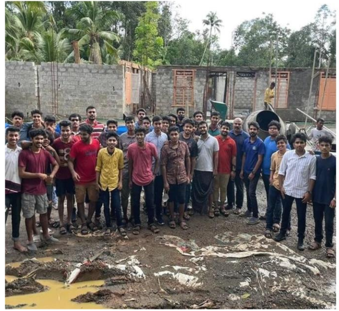
SJCET Students helping Construction Work