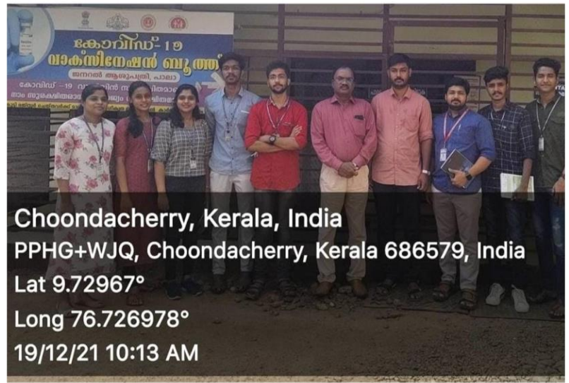
Mega Layout Design Campaign : Prepared the design of various buildings at Pala General Hospital on 19.12.2021