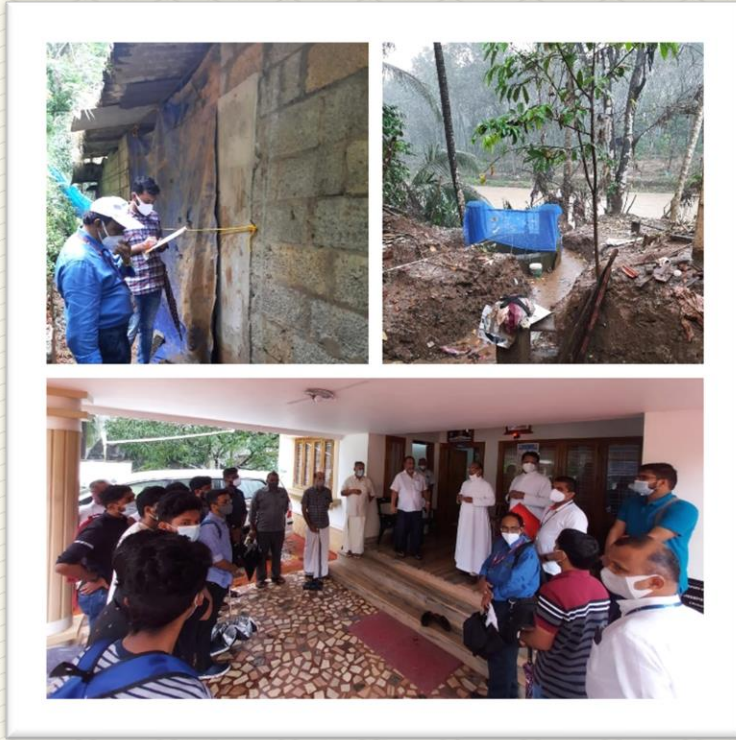
Testing of Structural competency of residential buildings at Kootickal after the flood occurred during Sept 2022 by Faculty and Students of SJCT, Palai