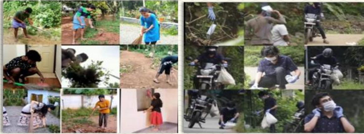
SWACHH BHARAT MISSION: NSS Volunteers of SJCT cleaning the surroundings of their places and was published through several social media platforms to provide awareness to the public on October 2 nd 2022